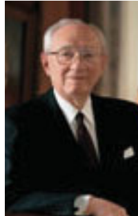
Gordon B. Hinckley