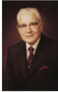
Harold B. Lee