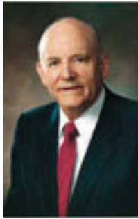
Howard W. Hunter