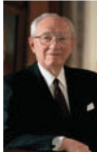
Gordon B. Hinckley