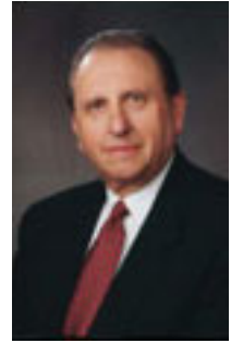
Thomas S. Monson