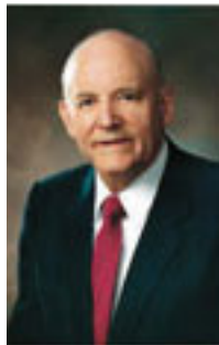
Howard W. Hunter