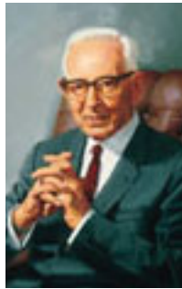
Joseph Fielding Smith