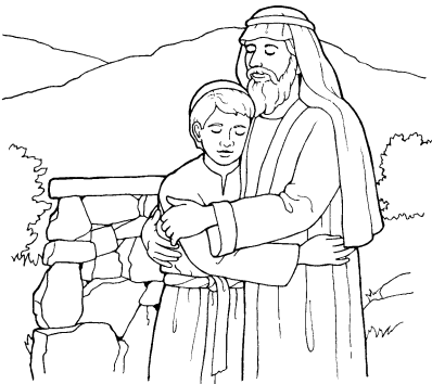
'Ēpalahame (Sēnesi 22:1-14)