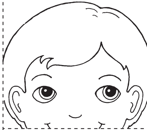
mstari wa 3

Kutengeneza karagosi, kata kwenye mstari mweusi. Kunja upande wa kushoto na upande wa kulia wa ukurasa kwenye mstari wa 1 na wa 2. Kisha kunja mistari ya 3, 4, na 5 nyuma na mbele jinsi ilivyoonyeshwa hapa chini ili kutengeneza karagosi mvulana au msichana. Katika nafasi tupu ndani ya kinywa cha karagosi, andika maneno mazuri unayoweza kuwaambia wengine. Tia vidole vyako ndani ya sehemu zilizo wazi tumia kikaragosi kufanya mazoezi ya kusema maneno ambayo ni ya ukarimu, ya kweli, na yenye kuinua.