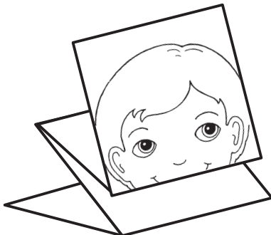
đường kẻ 5