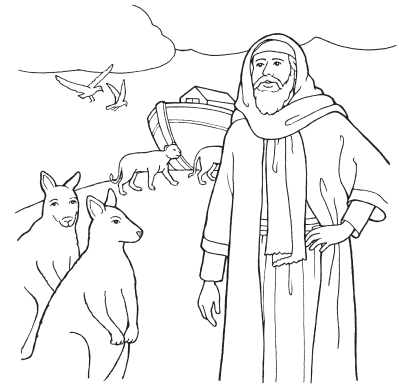
Noa (Postanak 6-8)

je vjerovati u ono što ne možemo vidjeti.