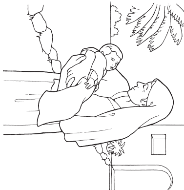
Sara (Postanak 21:1-8)