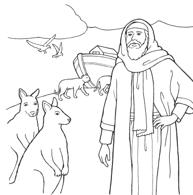
Noé (Gênesis 6-8)

é acreditar em coisas que não podemos ver.