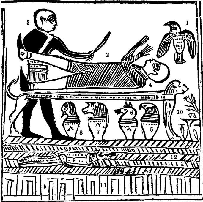
ຄຳອະທິບາຍ