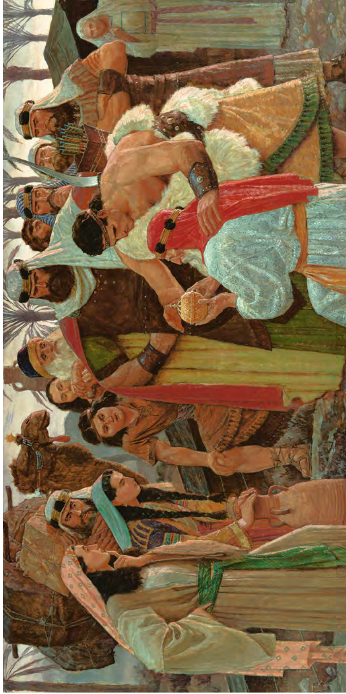
Легий находит Лилахону С картины Арнольда Фриберга См. 1 Нефий 16, стр. 38–42