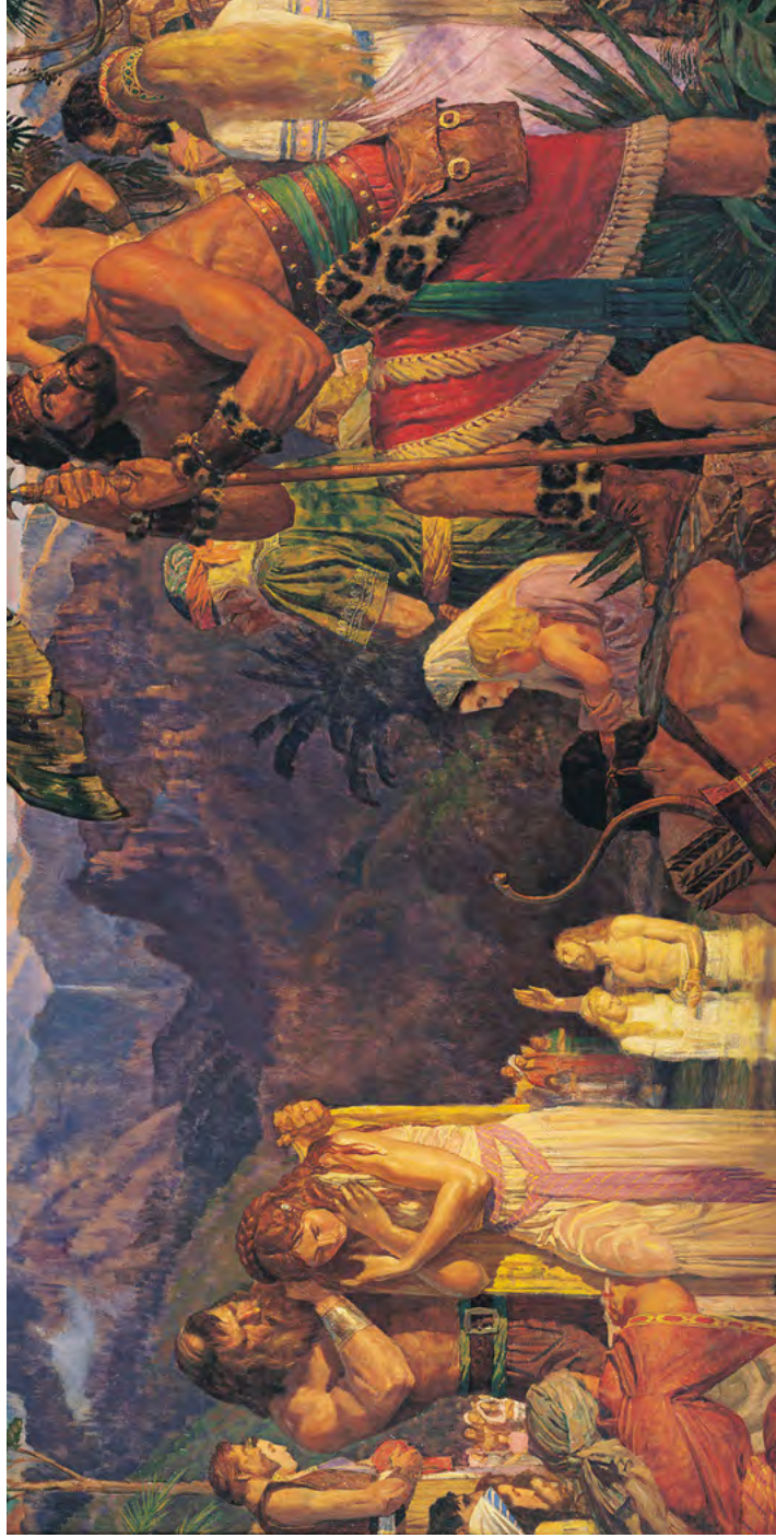
Алма крестит в водах Мормона Скартины Арнольда Фриберга