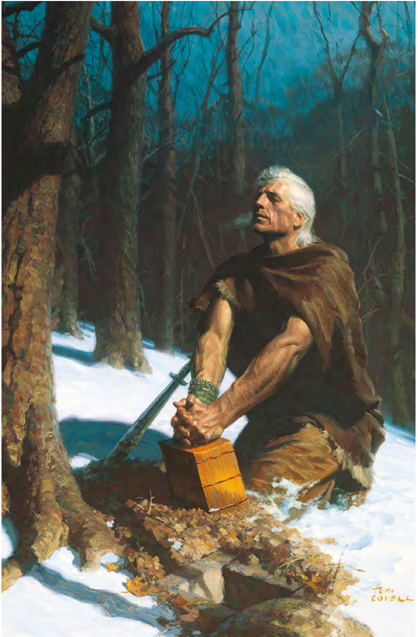
Мороний прячет летопись нефийцев С картины Тома Ловелла См. Мормон 8, стр. 574–578