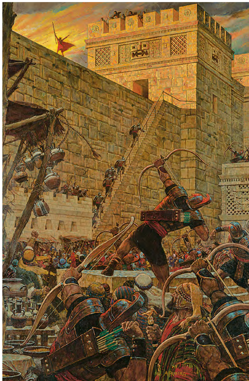
Самуил-Ламаниец пророчествует С картины Арнольда Фриберга