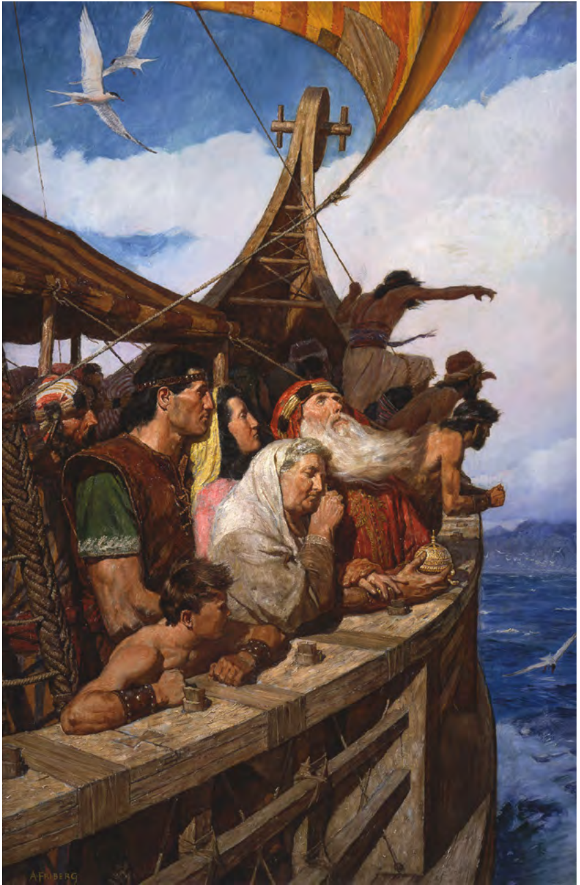
Легий и его народ прибывают в землю обетованную С картины Арнольда Фриберга