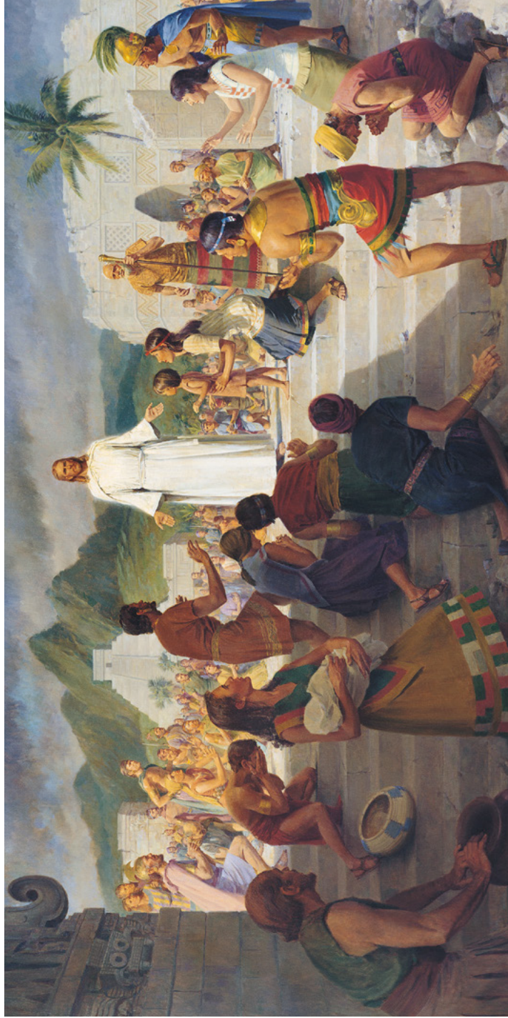
ພະເຊຊູຄຣີດຢັງມາຢາມອາເມຣິກາ ແຕ້ມໂດຍ ຈອນ ສະກາດ