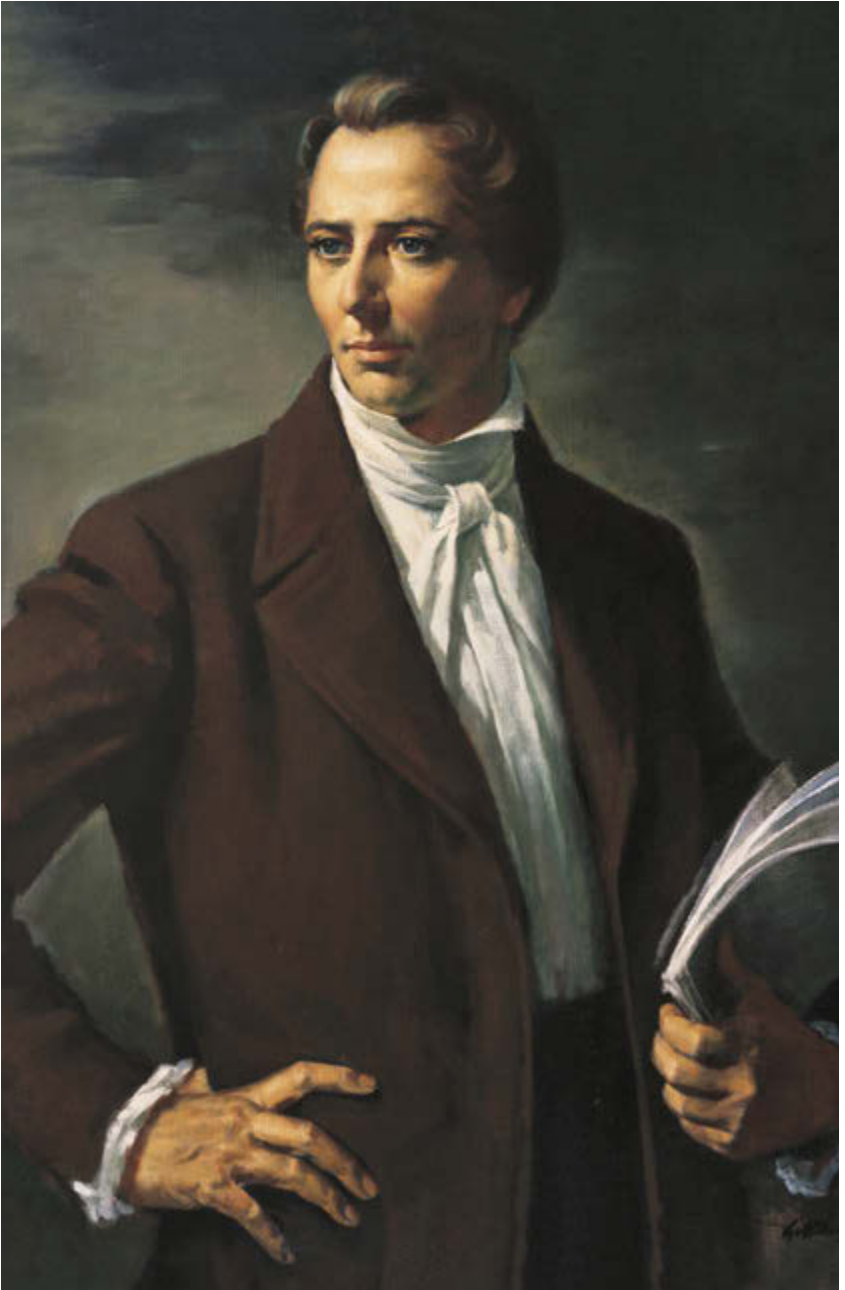
Mwet Pahluh Joseph Smith Sroal uh sel Alvin Gittins

Liye "Kahs in Fahkwack Luhlahlfongi Lal Mwet Pahluh Joseph Smith," sra puk xi-xiv