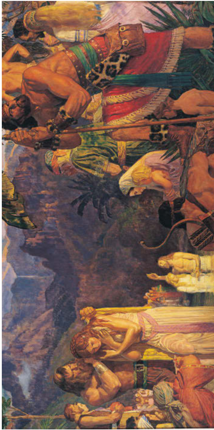
Alma el pacptaisi mawet ke Kof luhn Mormon Sroal uh sel Arnold Friberg