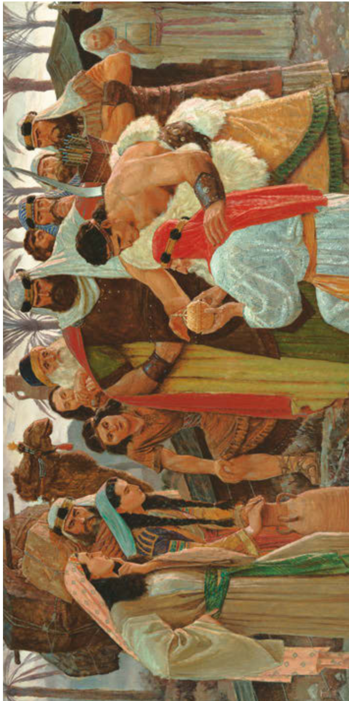
Lehi el sokwack Liahona Sroal uh sel Arnold Friberg