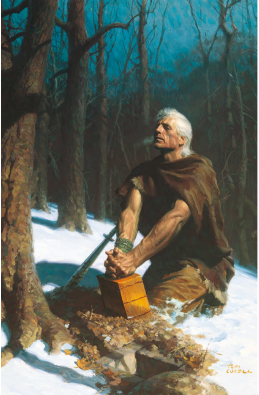
Moronai a peiasenano uruon ekkewe chon Nifai Chunga seni Tom Lovell