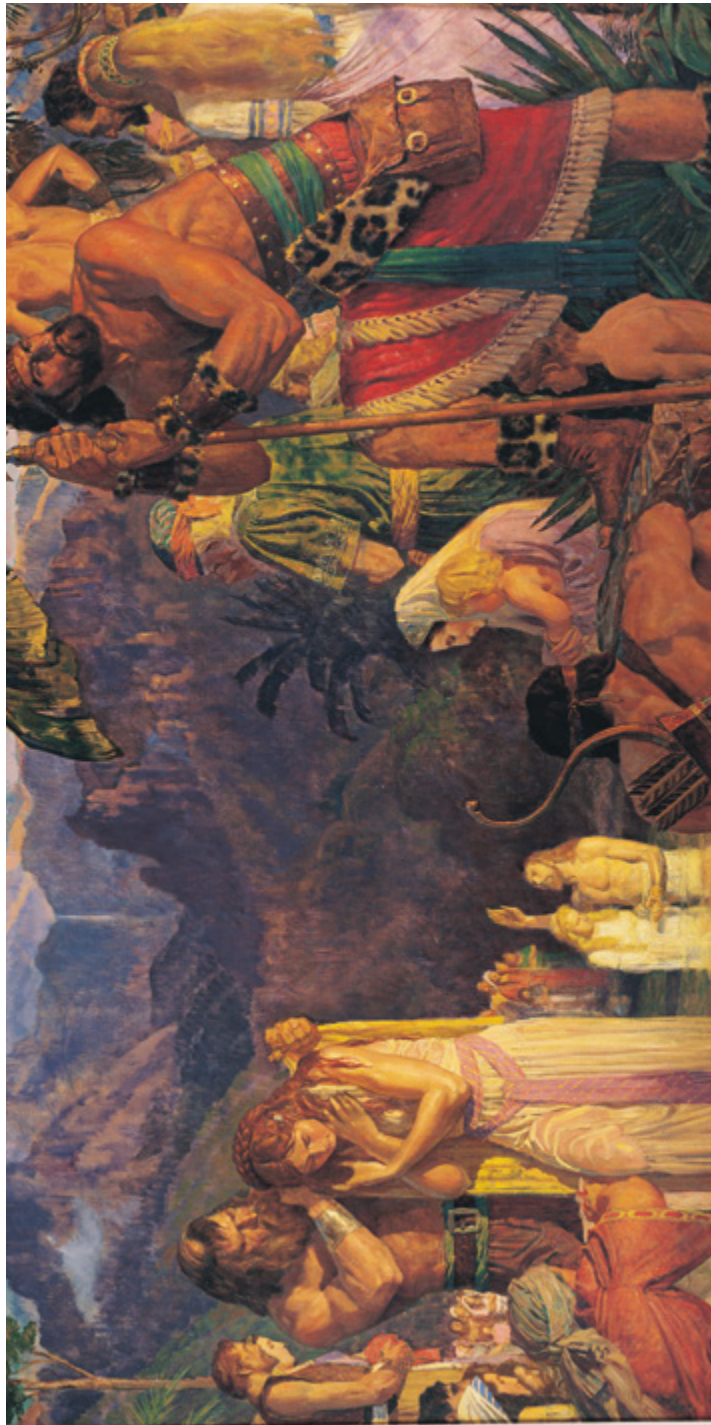
Alma a papataisi aramas non ewe Konikin Mormon Chunga seni Arnold Friberg