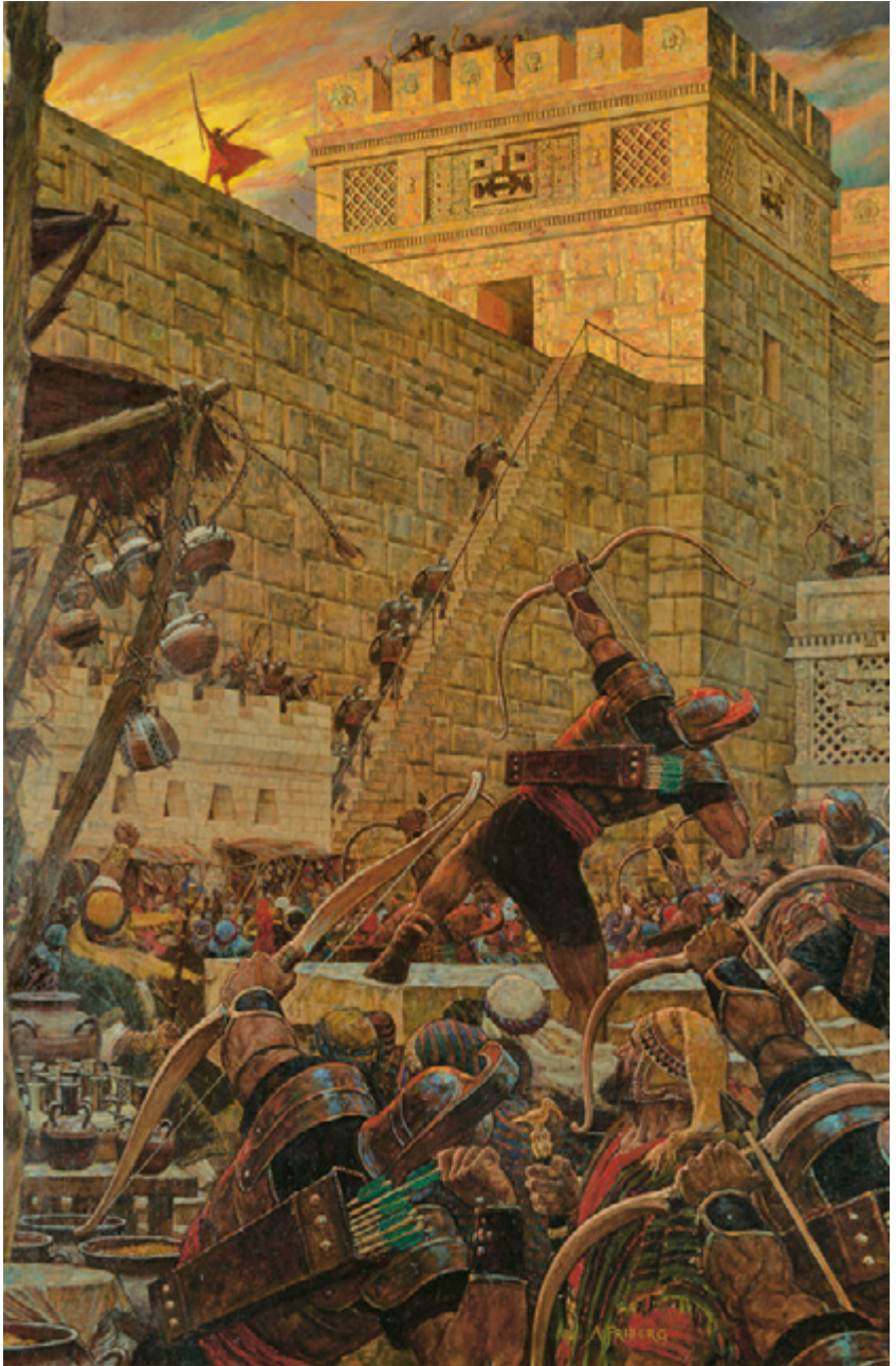
Samuel ewe chon Leiman a osini Chunga seni Arnold Friberg Nengeni Ilaman 16, peich 494–496