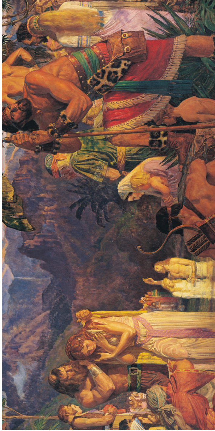
Alma döper i Mormons vatten Målning av Arnold Friberg