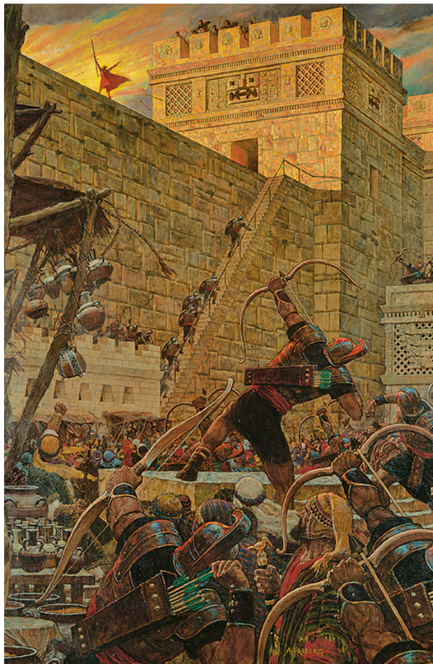
Самуїл Ламанієць пророкує Картина Арнольда Фріберга Див. Геламан 16, сторінки 485–488