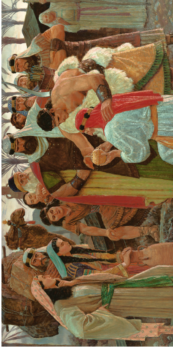
Легій знаходить Ліягону Картина Арнольда Фріберга Див. 1 Нефій 16, сторінки 38–42