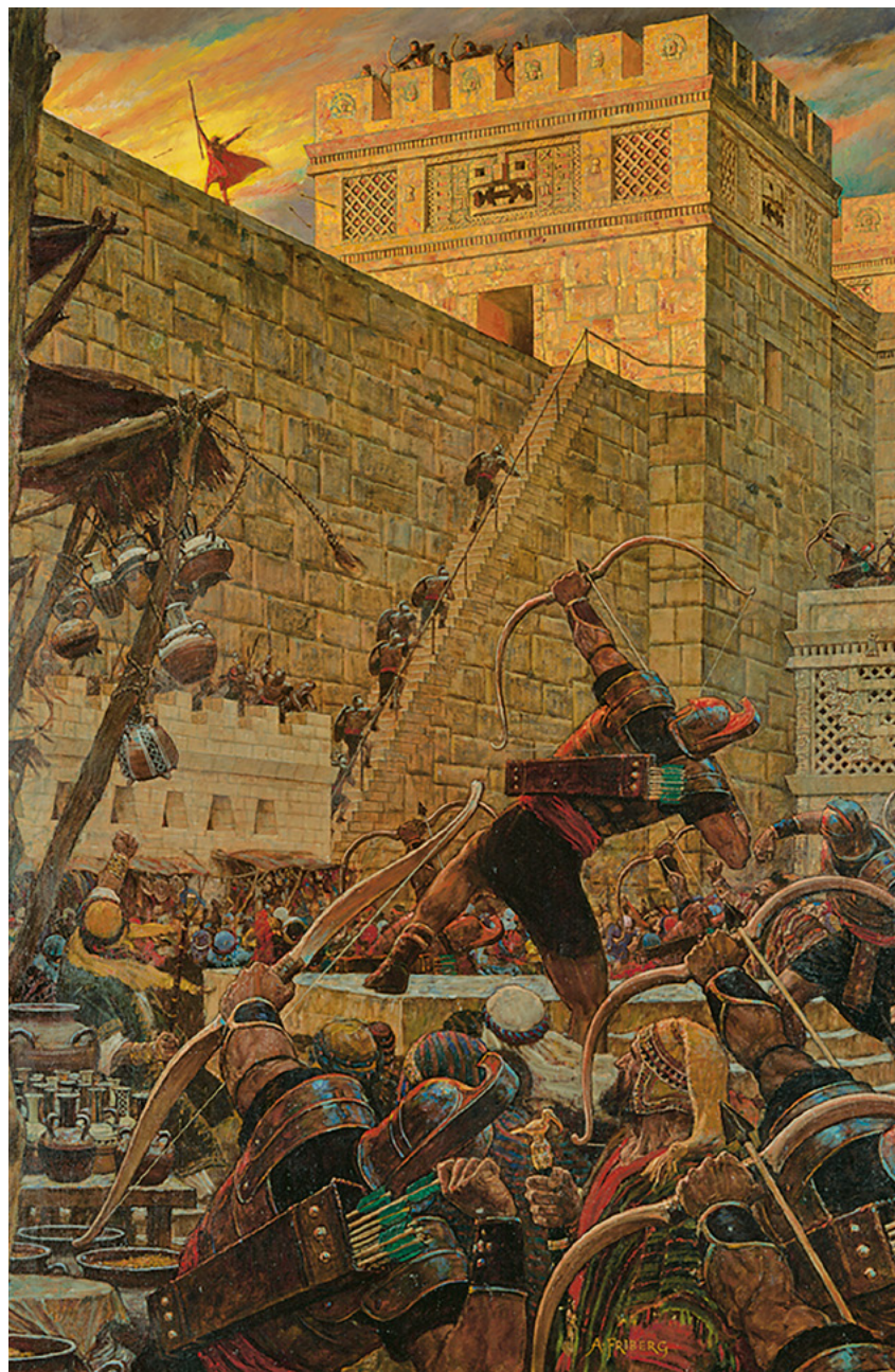
Lamanitten Samuel profeterer Maleri: Arnold Friberg