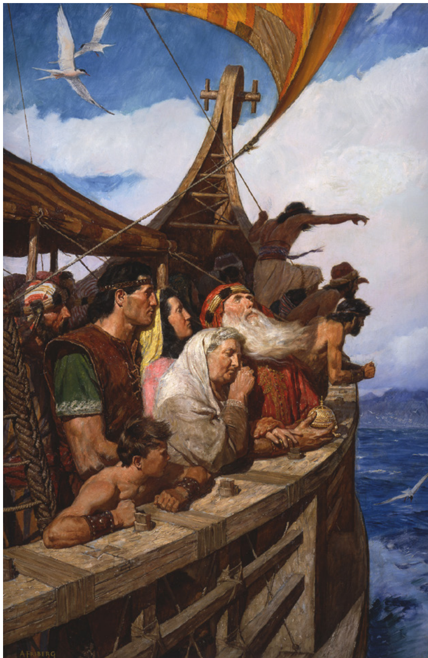
Lehi in njegovi ljudje prispejo v obljubljeni deželo Naslikal Arnold Friberg.