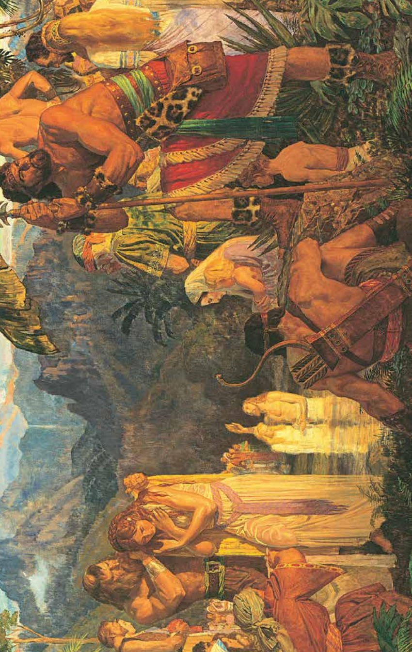
Te bapetizo nei o Alama i roto i te pape i Moromona.