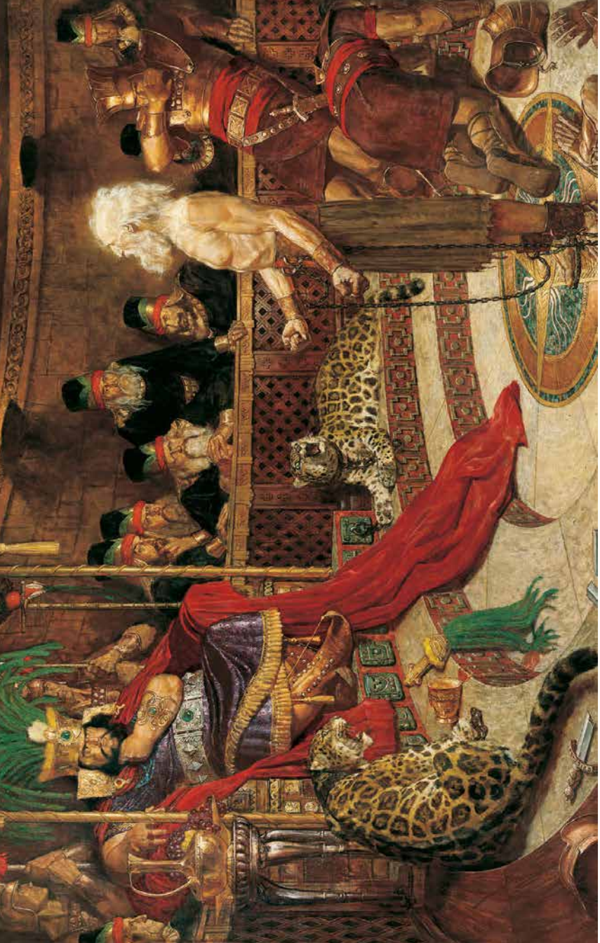
Te horoa'tu nei o Abinadi i ta'na parau i te Arii Noa