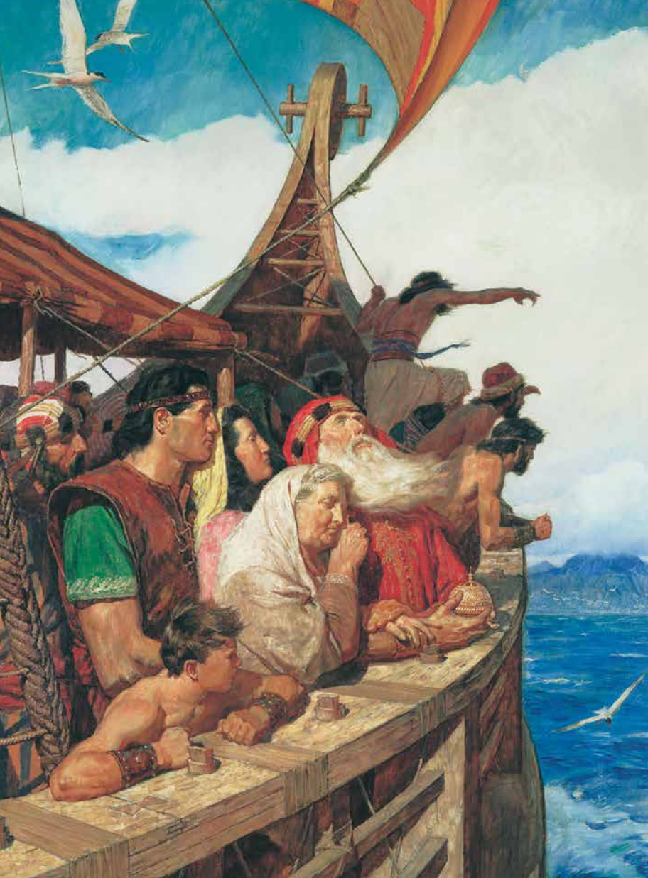
Te taeraa o Lehi e to'na mau taata i te fenua i parauhi ra.