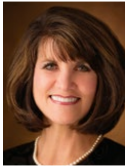
โดยจอย เอ. สตีเวนส์ ที่ปรึกษาที่หนึ่งในฝ่ายประธานปฐมวัยสามัญ