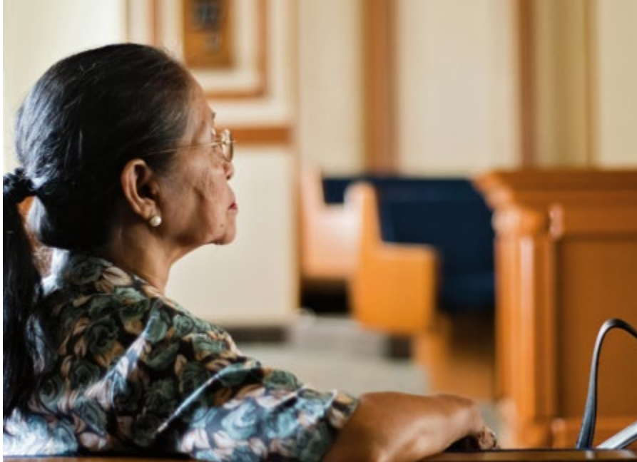
ศาสตราจารย์ อีดี, ฟิลิปปินส์

ไม่มีงานเลี้ยงฉลอง พวกท่านมุ่งความสำคัญไปที่พระวิหารและพันธสัญญา สำหรับท่านทั้งสองพันธสัญญาคือทุกสิ่ง หลังจากแต่งงานได้เพียงหกวันและอำลาด้วยน้ำตาแล้วคุณพ่อก็เดินทางไปแอฟริกาใต้