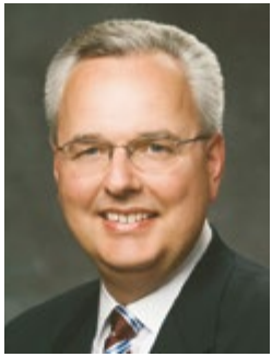
โดยเจ็ลเคอร์เจมส์ เจ. ฮามูลา แห่งสวากเจ็ดสิบ