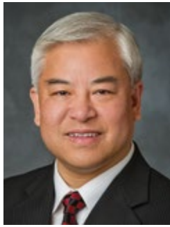
โดยเอ็ลเดอร์ เจี ฮอง (แซม) วอง แห่งสาวกเจ็ดสิบ