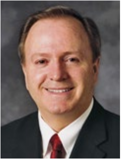
โดยเอ็ลเคอร์ลินน์ จี. ครอบบินส์ แห่งฝ่ายประธานโคออร์ดิเนตอรร่วมสวากเจ็ดสิบ