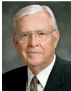
Élder M. Russell Ballard Do Quórum dos Doze Apóstolos