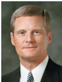
Par David A. Bednar du Collège des douze apôtres

Je vous exhorte également à choisir aujourd'hui d'honorer cette grande bénédiction et à vous préparer à progresser dans chaque office de la Prêtrise d'Aaron : diacre, instructeur et prêtre. Préparez-vous pour la grande bénédiction de recevoir la Prêtrise de Melchisédek, que vous devrez être dignes de détenir avant de faire une mission à plein temps. Le Seigneur a besoin que vous vous prépariez à être à son service, particulièrement pour la grande responsabilité que vous aurez de proclamer son Évangile au monde. Je vous promets que, si vous vous préparez à recevoir sa sainte prêtrise, il déversera littéralement des bénédictions sur votre tête. Je vous en rends témoignage, au nom de notre Seigneur et Sauveur, Jésus-Christ. Amen. ■