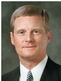
Vanhin David A. Bednar kahdentoista apostolin koorumista

Haastan teidät myös päättämään tänään, että kunnioitatte tätä suurta siunausta ja valmistaudutte ennalta jokaiseen Aaronin pappeuden virkaan – diakoniksi, opettajaksi ja papiksi. Valmistautukaa suureen siunaukseen saada Melkisedekin pappeus, joka teidän täytyy kelvollisina ottaa vastaan ennen kuin palvelette kokoaikaisena lähetyssaarnaajana. Herra tarvitsee teidän valmistautumistanne Hänen palvelukseensa, etenkin siihen suureen tehtävään, joka teillä on julistaa Hänen evankeliumiaan maailmalle. Lupaan teille, että jos valmistaudutte ottamaan vastaan Hänen pyhän pappeutensa, Hän sananmukaisesti vuodattaa siunauksia päanne päälle. Tämän todistuksen jätän teille Herramme ja Vapahtajamme, Jeesuksen Kristuksen nimessä. Aamen. ■