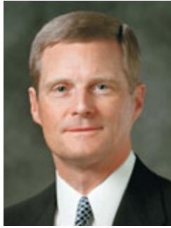
Vanhin David A. Bednar kahdentoista apostolin koorumista

Haastan teidät myös päättämään tänään, että kunnioitatte tätä suurta siunausta ja valmistaudutte ennalta jokaiseen Aaronin pappeuden virkaan – diakoniksi, opettajaksi ja papiksi. Valmistautukaa suureen siunaukseen saada Melkisedekin pappeus, joka teidän täytyy kelvollisina ottaa vastaan ennen kuin palvelette kokoaikaisena lähetyssaarnaajana. Herra tarvitsee teidän valmistautumistanne Hänen palvelukseensa, etenkin siihen suureen tehtävään, joka teillä on julistaa Hänen evankeliumiaan maailmalle. Lupaan teille, että jos valmistaudutte ottamaan vastaan Hänen pyhän pappeutensa, Hän sananmukaisesti vuodattaa siunauksia päanne päälle. Tämän todistuksen jätän teille Herramme ja Vapahtajamme, Jeesuksen Kristuksen nimessä. Aamen. ■