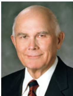
Vanhin Dallin H. Oaks kahdentoista apostolin koorumista