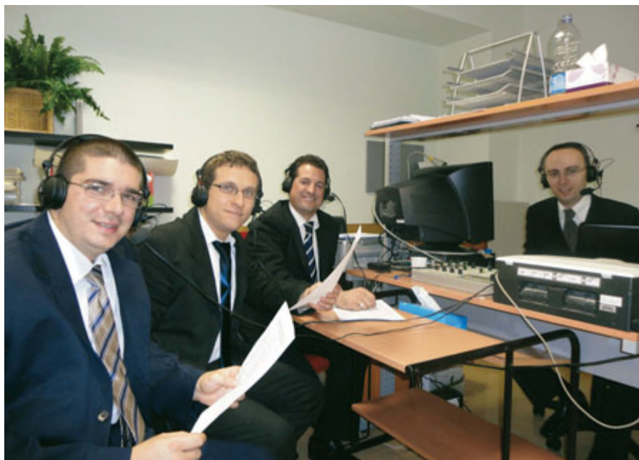
Члены Церкви в Риме, Италия, переводят выступления Генеральной конференции.

был почти при смерти. Я услышал небольшой шум среди медперсонала в больничном коридоре. Внезапно в палату вошел Президент Спенсер В. Кимбалл. Он присел на стул с другой стороны кровати напротив меня. Я подумал: «Сейчас у меня появился шанс послушать и понаблюдать за человеком, который лучше многих способен служить тем, кто испытывают боль и страдание».