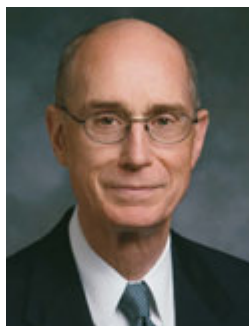
Президент Генри Б. Айринг Первый советник в Первом Президентстве