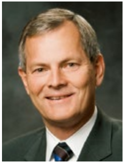
管理ビショップ ゲリー・E・スティーブソンビショップ