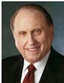
Președintele Thomas S. Monson