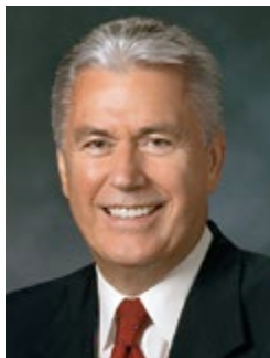
Ni Presidente Dieter F. Uchtdorf

Mopamatuod ko nga kini Simbahan sa Ginoo. Gipili kamo sa pag-apil sa Iyang buhat karon kay Siya misalig kaninyo nga makahimo og maayong pagpili. Kamo ang pinili nga henerasyon. Sa pangalan ni Jesukristo, amen. ■