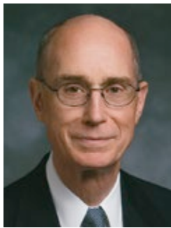
Ni Presidente Henry B. Eyring