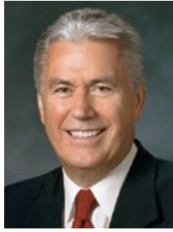
Ni Presidente Dieter F. Uchtdorf

Mopamatuod ko nga kini Simbahan sa Ginoo. Gipili kamo sa pag-apil sa Iyang buhat karon kay Siya misalig kaninyo nga makahimo og maayong pagpili. Kamo ang pinili nga henerasyon. Sa pangalan ni Jesukristo, amen. ■