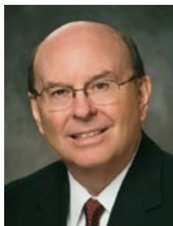
Vârșnicul Quentin L. Cook din Cvorumul celor Doisprezece Apostoli