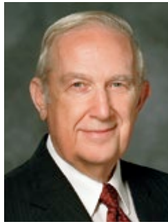
Ni Elder Richard G. Scott

Sa Korum sa Napulog Duha ka mga Apostoles