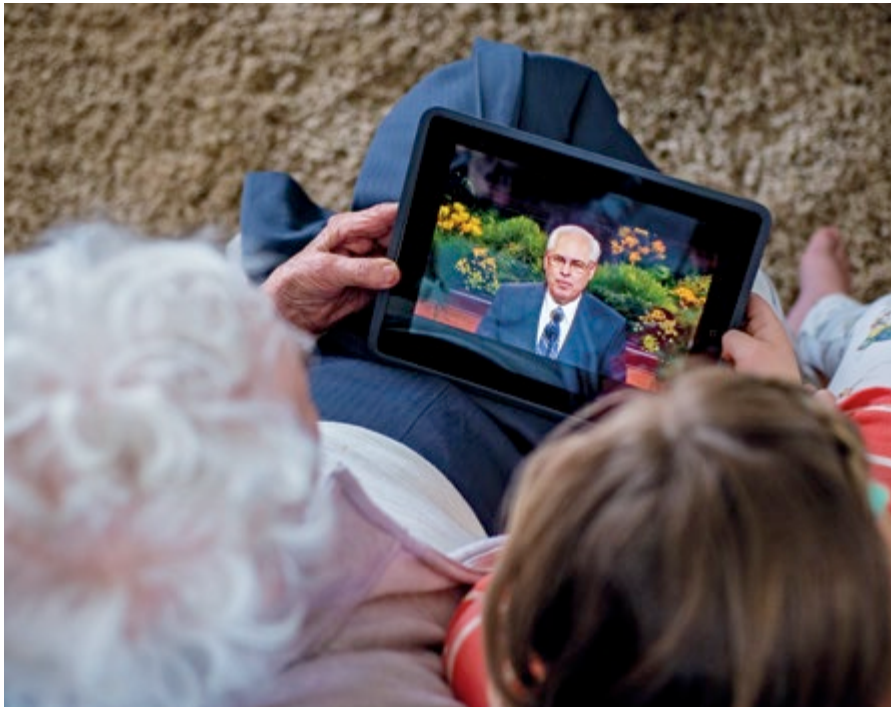
Раймонд, провинция Альберта, Канада

а мобильные устройства с выходом в Интернет? 2