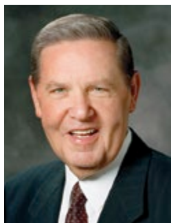
Vârstnicul Jeffrey R. Holland din Cvorumul celor Doisprezece Apostoli