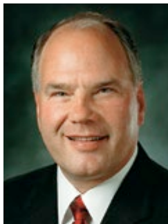
Vârstnicul Ronald A. Rasband din Președinția celor Șaptezeci