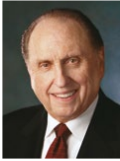
Presidentti Thomas S. Monson

Julistan apostolisen todistukseni siitä, että Isä ja Poika elävät. Ilmoituksen henki on todellinen – ja se voi toimia ja se toimii omassa elämässämme sekä Myöhempien Aikojen Pyhien Jeesuksen Kristuksen Kirkossa. Näistä totuuksista todistan Herran Jeesuksen Kristuksen pyhässä nimessä. Amen. ■