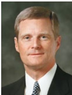
Vanhin David A. Bednar kahdentoista apostolin koorumista