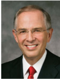
닐 엘 앤더슨 장로 십이사도 정원회

것과 별반 다르지 않[습니다.]”(“오늘 다른 사람을 위해 무엇을 했나?”, 리야호나, 2009년 11월호, 85쪽)