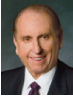
Saunia e Peresitene Thomas S. Monson