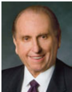
Præsident Thomas S. Monson