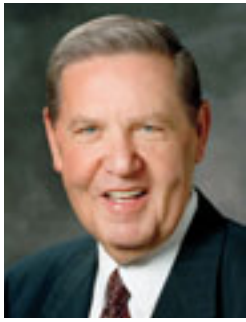
Ni Elder Jeffrey R. Holland

Sa Korum sa Napulog Duha ka mga Apostoles