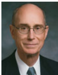
Ni Presidente Henry B. Eyring