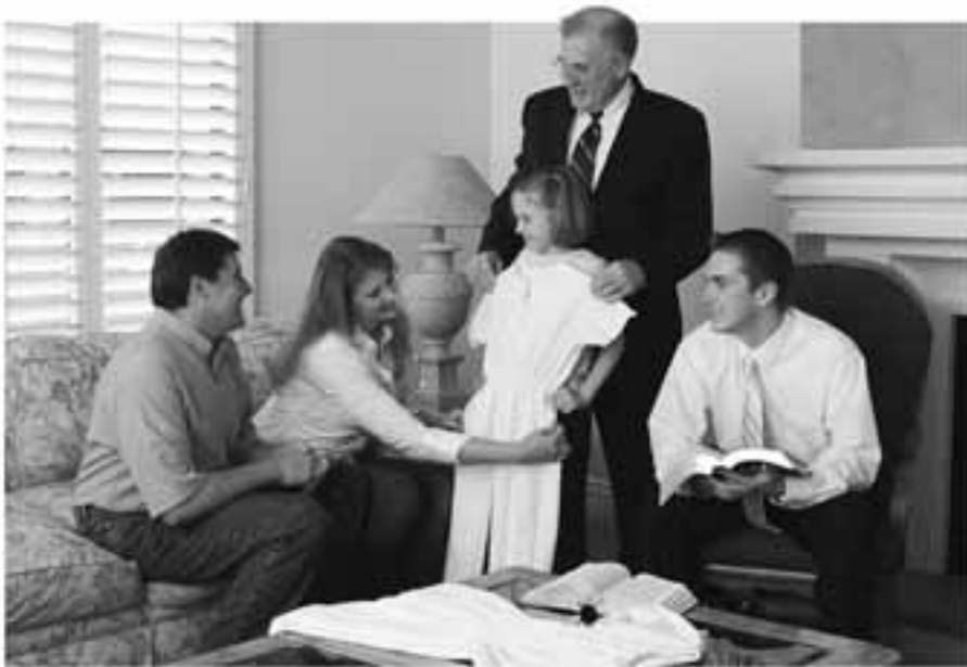
Sinusuportahan ng mga lider ang mga magulang sa pamamagitan ng paggalang sa kanila, hindi sa pangunguna sa buhay ng kanilang anak.

kailangan nila ng permanenteng trabaho, mga organisasyong kabibilangan, at mga anak kung kaya nila. Mabilis nang nawawala sa uso ang marangal na papel ng isang ina. Liliwanagin ko ito: hindi natin dapat tulutan ang mundo na ilagay sa pang-anib ang alam nating ibinigay sa atin sa plano ng Diyos.