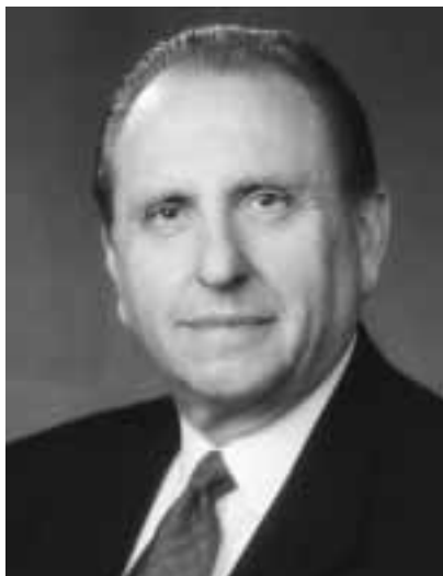
PANGULONG THOMAS S. MONSON Unang Tagapayo sa Unang Panguluhan