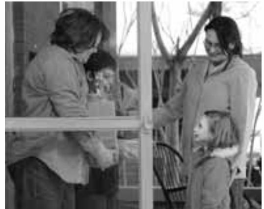
Ang paglilingkod natin sa ating pamilya at mga tungkulin sa Simbahan ay walang hanggan ang kapalit.

Hinding-hindi ko binanggit ang mga donasyon sa handog-ayuno, dahil