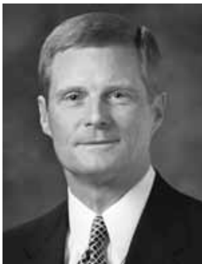
ELDER DAVID A. BEDNAR Ng Korum ng Labindalawang Apostol