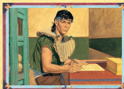
MORMON (CHAPITRE 49)