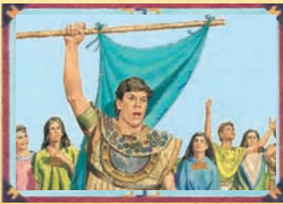
CAPITAINE MORONI (CHAPITRE 32)