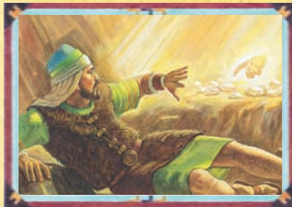
FRÈRE DE JARED (CHAPITRE 51)