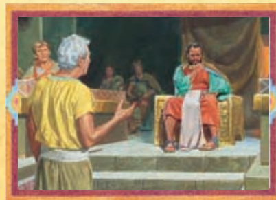
ABINADI ET LE ROI NOÉ (CHAPITRE 14)