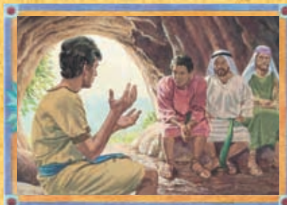
NÉPHI, SAM, LAMAN, LÉMUEL (CHAPITRE 4)