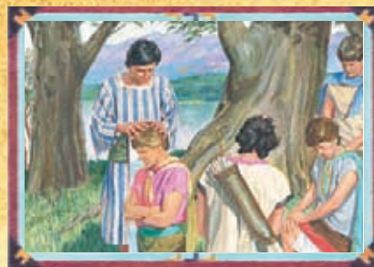
ALMA (CHAPITRE 15)