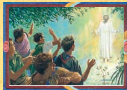
ALMA LE JEUNE (CHAPITRE 18)