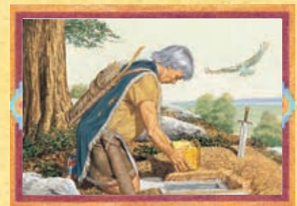
MORONI (CHAPITRE 54)