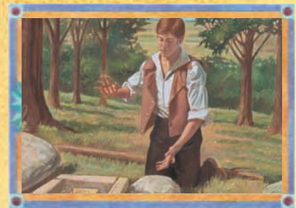
JOSEPH SMITH (CHAPITRE 1)