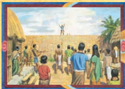
SAMUEL LE LAMANITE (CHAPITRE 40)