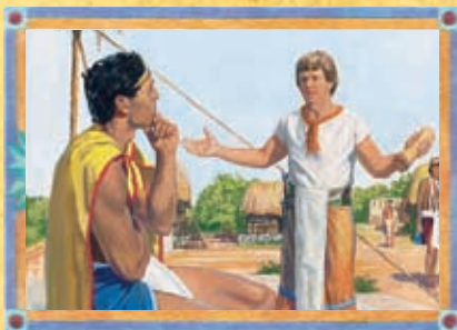
AMMON ET LE ROI LAMONI (CHAPITRE 23)