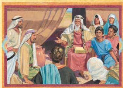
LÉHI (CHAPITRE 6)