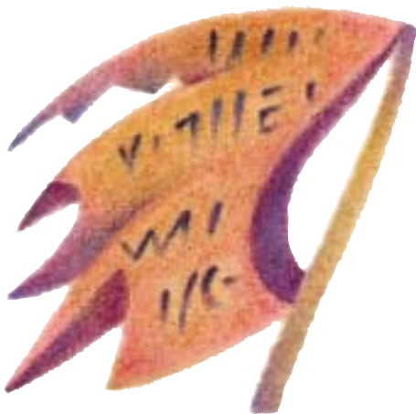
자유 의 기치