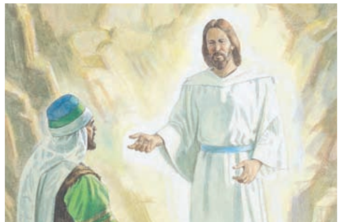
Jesus belehrte Jareds Bruder und zeigte ihm vieles. Er gebot ihm, alles aufzuschreiben, was er gesehen und gehört hatte. Ether 3:25–27.