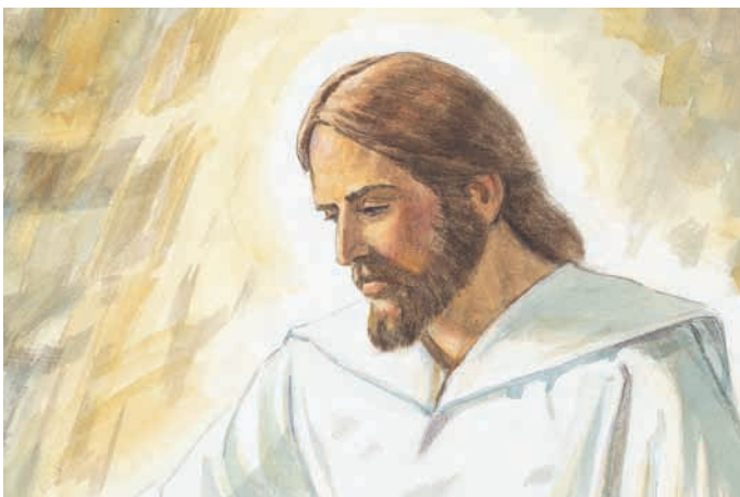
Jesus sagte, daß alle, die an ihn glauben, ewiges Leben haben werden. Ether 3:14.