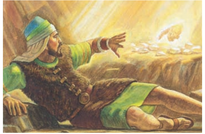
Der Herr streckte die Hand aus und berührte jeden Stein mit dem Finger. Ether 3:6.