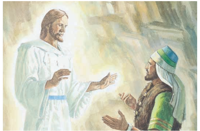
Dann zeigte sich der Herr Jareds Bruder ganz. Ether 3:13.