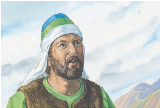
Weil Jareds Bruder so großen Glauben hatte, sah er den Finger des Herrn. Dieser sah genauso aus wie der Finger eines Menschen. Ether 3:6,9.