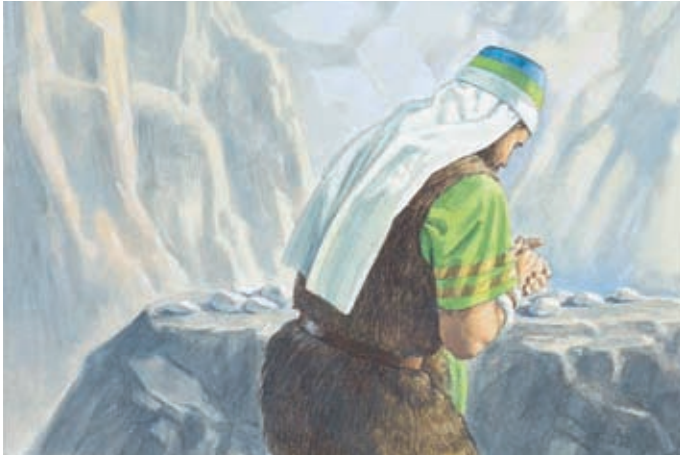
Jareds Bruder bat den Herrn, die Steine zu berühren, damit sie in den Schiffen leuchteten. Ether 3:4.