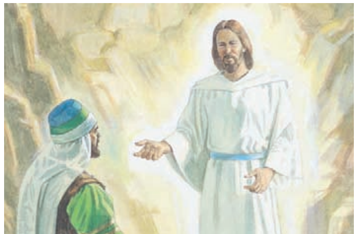
耶穌教導雅列的哥哥許多事情，也向他顯現許多事情。耶穌吩咐他把所看見的和所聽見的都寫下來。 以帖書3：25-27