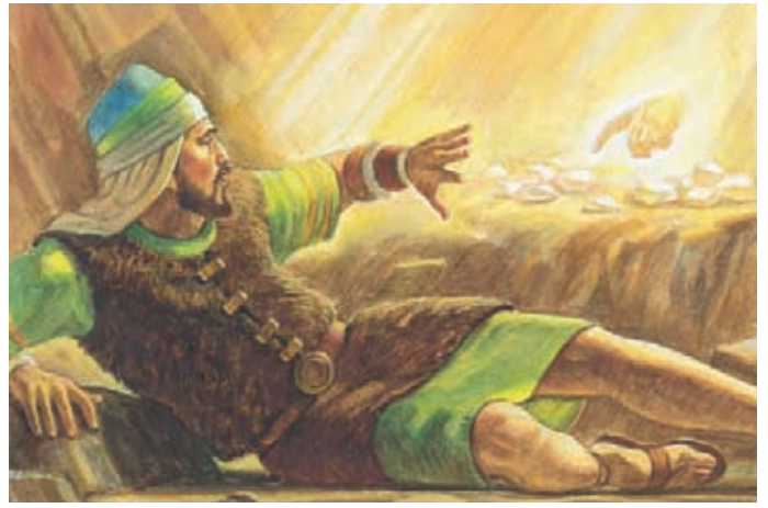
主用手指觸摸每一顆石子。 以帖書3：6