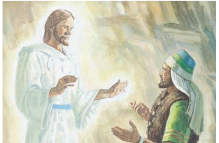
然後，主向雅列的哥哥顯現。 以帖書3：13