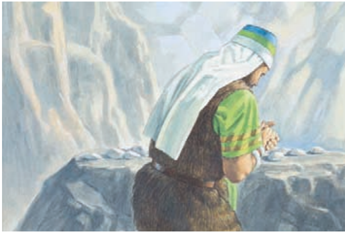
雅列的哥哥求主觸摸石子，讓它們在平底船裡發光。 以帖書3：4