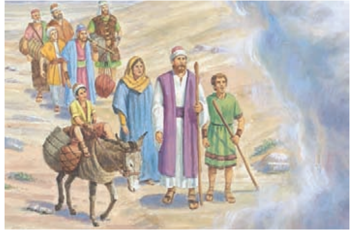
Los Jareditas viajaron hacia el desierto. El Señor les habló desde una nube y les indicó por dónde habían de ir. Éter 2:5.