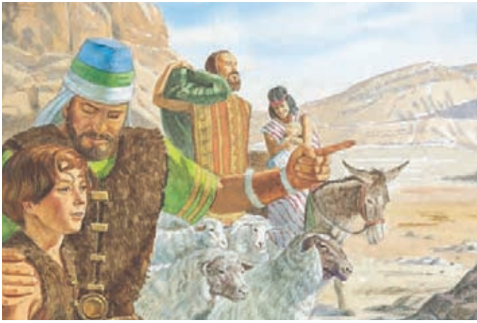
El Señor dijo que conduciría a los Jareditas a una tierra prometida. Éter 1:42.