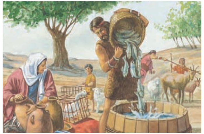
Los Jareditas atraparon aves y peces y los llevaron consigo. Éter 2:2.