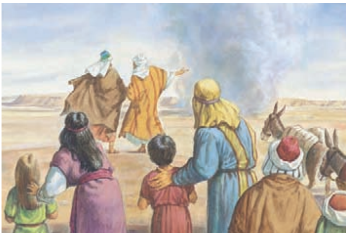
El Señor dijo que los que vivieran en la tierra prometida debían servir a Dios o serían destruidos. Éter 2:7-8.