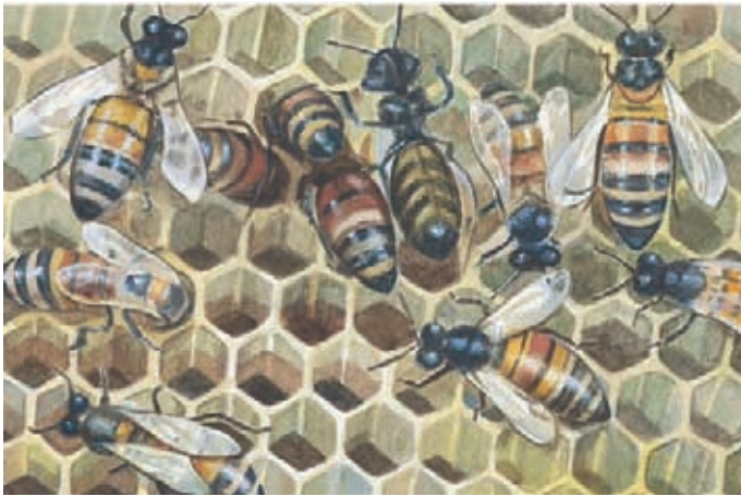
Llevaron enjambres de abejas. Éter 2:3.