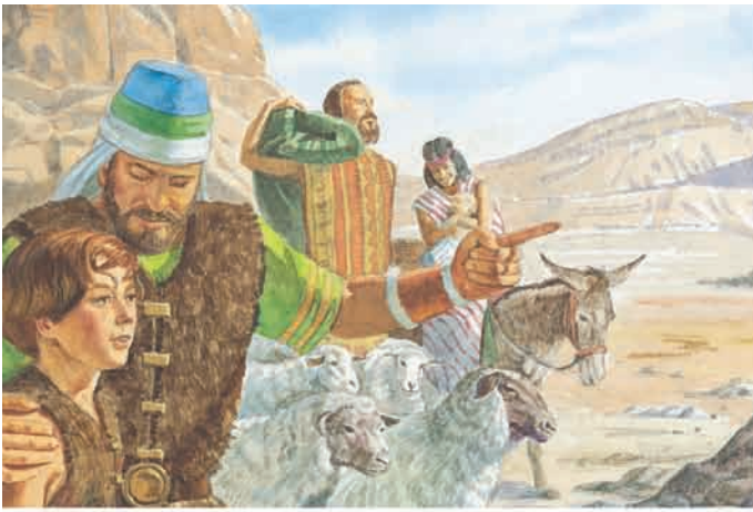
O Senhor disse que conduziria os Jareditas a uma terra prometida. Éter 1:42