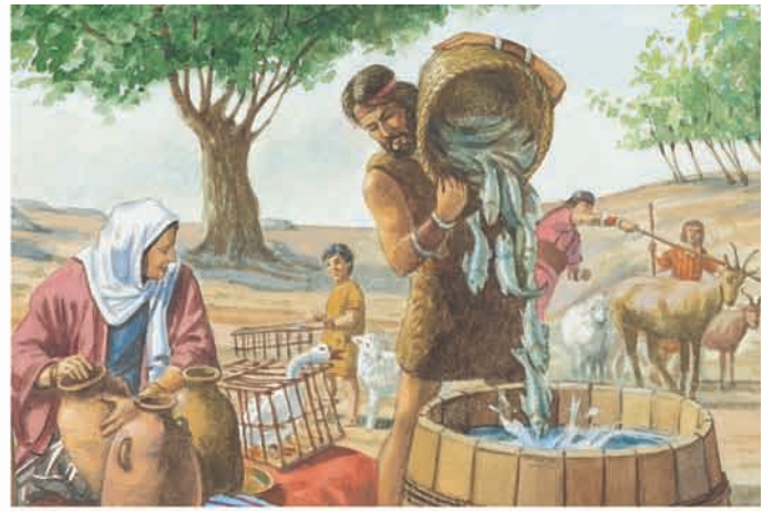
Os Jareditas pegaram aves e peixes para levar consigo. Éter 2:2