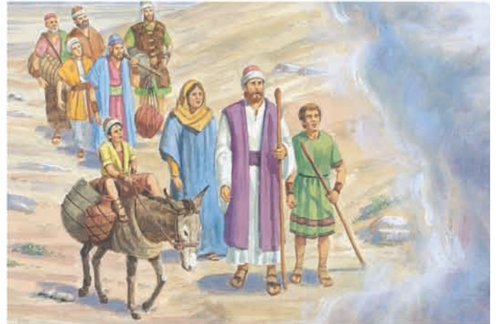
Os Jareditas viajaram pelo deserto. O Senhor falou com eles de uma nuvem e indicou-lhes a direção. Éter 2:5