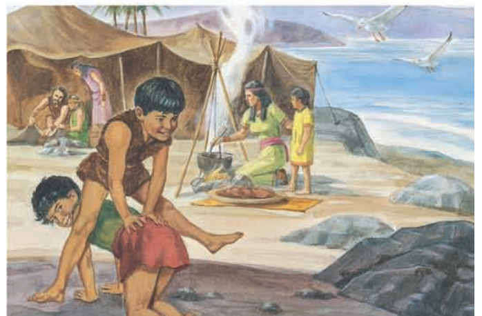
Os Jareditas armaram suas tendas logo que chegaram à beira-mar, e lá permaneceram durante quatro anos. Éter 2:13