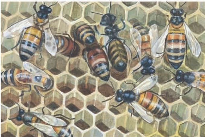
Eles levaram enxames de abelha. Éter 2:3