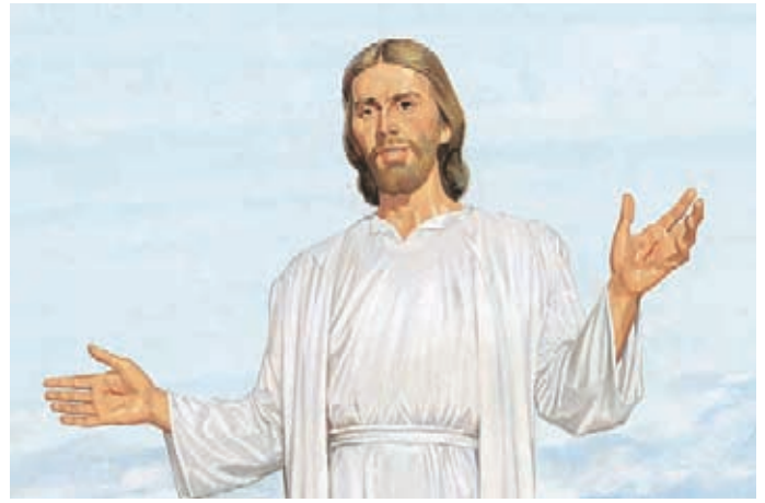
Mormón había tratado de enseñar la verdad a los nefitas; les había dicho cuán importante era tener fe en Jesucristo. Moroni 7:1, 33, 38.