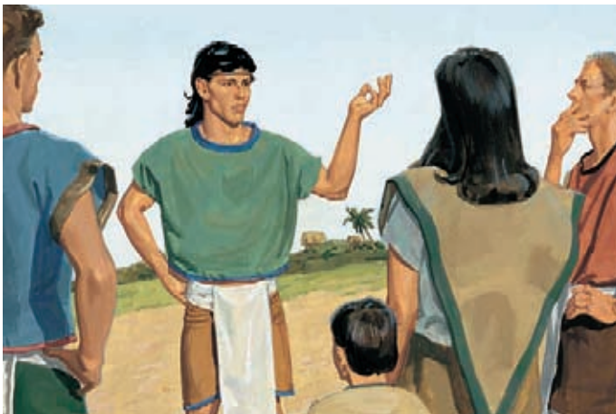
Había tratado de enseñarles a tener esperanza por medio de la expiación de Jesucristo y a tener caridad, que es el amor puro de Cristo. Moroni 7:40–41, 47.