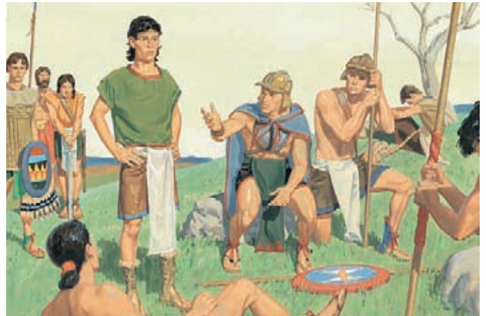
Los lamanitas empezaron a derrotar a los nefitas en cada batalla; Mormón decidió dirigir nuevamente los ejércitos nefitas. Mormón 4:18; 5:1.