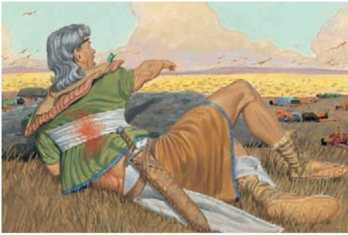
Mormón estaba triste por la muerte de tantos nefitas, pero él sabía que habían muerto porque habían rechazado a Jesús. Mormón 6:16–18.