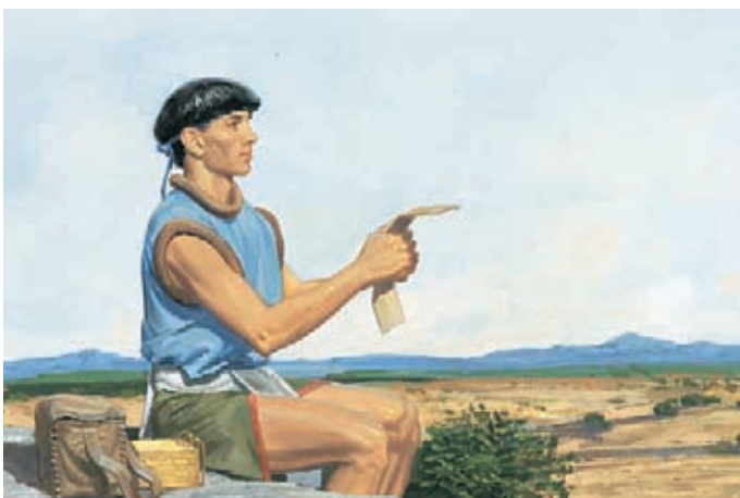
Mormón escribió acerca de la terrible iniquidad de los nefitas. Le pidió a Moroni que permaneciera fiel a Jesucristo. Moroni 9:1, 20, 25.