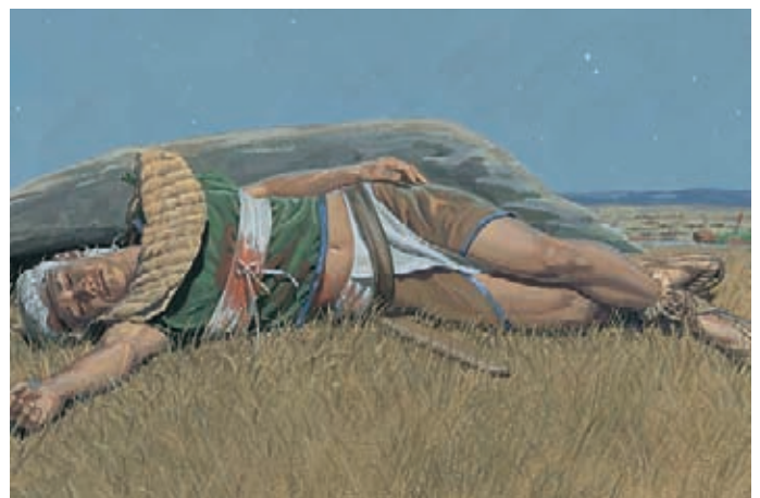
Los lamanitas mataron a Mormón y a todos los nefitas, menos a Moroni, quien terminó de escribir los registros. Mormón 8:2–3.