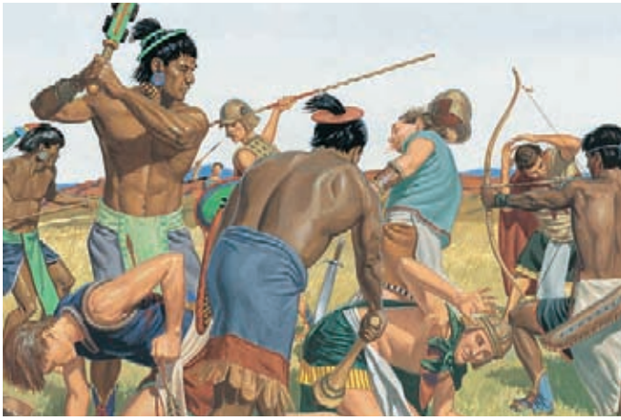
No obstante, los nefitas se habían vuelto tan inicuos que el Señor no los ayudaba. Mormón 2:26.