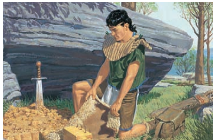
Mormón sacó todos los registros de la colina donde Ammarón los había escondido y escribió para la gente que algún día leería ese registro. Mormón 4:23; 5:9, 12.