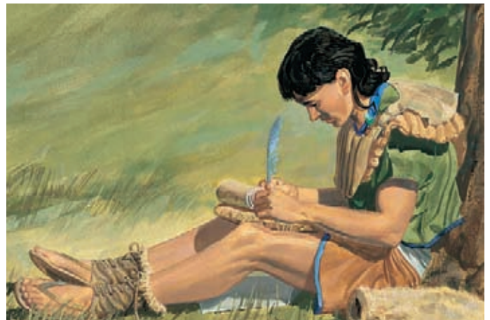
Y Mormón le había escrito cartas a su hijo Moroni, quien también había enseñado el Evangelio a los nefitas. Moroni 8:1–2.