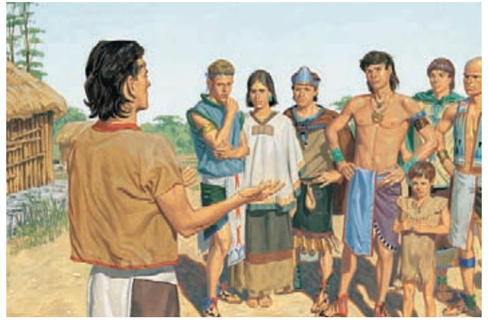
Mormón dijo a los nefitas que se salvarían sólo si se arrepentían y se bautizaban; pero el pueblo se negó a hacerlo. Mormón 3:2-3.