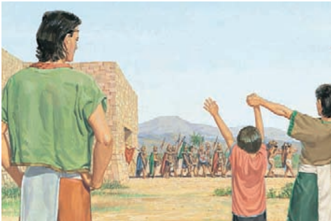
Ellos se jactaron de su fuerza, diciendo que matarían a todos los lamanitas. Debido a la iniquidad de los nefitas, Mormón se negó a seguir siendo su líder. Mormón 3:9-11.