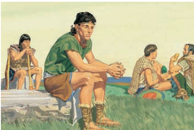
Él sabía que los nefitas inicuos no ganarían la guerra; no se arrepintieron ni oraron para pedir la ayuda que necesitaban. Mormón 5:2.